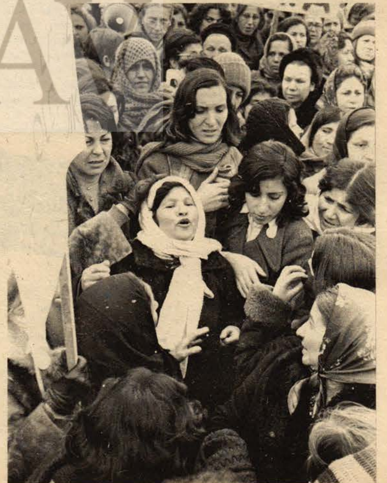
BİR ANA, OĞLUNUN İŞKENCEDE OLDUĞUNU SÖYLÜYÖRÜ.